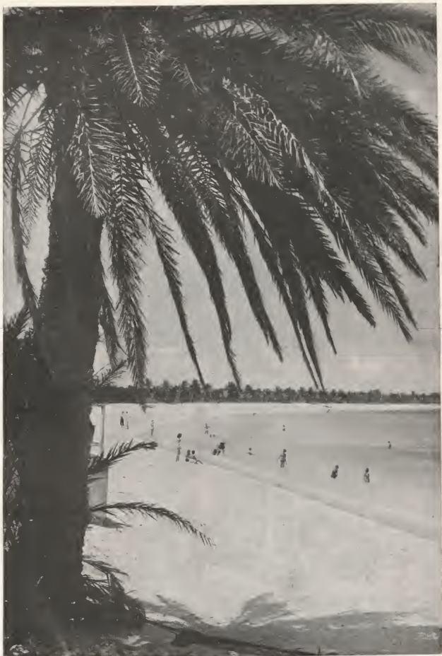
Shade, sun, beach, just 7 hours from New York City